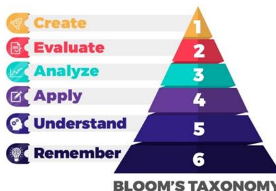
Obrázek 1. Bloomova taxonomie

→ Pro tvorbu výsledků učení FWSS byla zvolena metodika Bloomovy taxonomie rozdělená do šesti úrovní cílů, jak je znázorněno na obrázku: